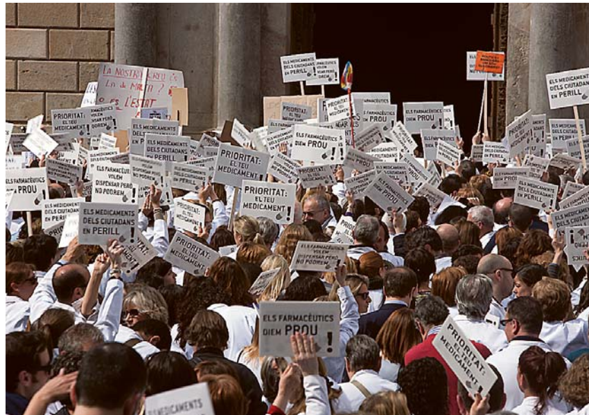
Los impagos de recetas a boticas desde 2008 llegaron a provocar cierres patronales y huelgas.